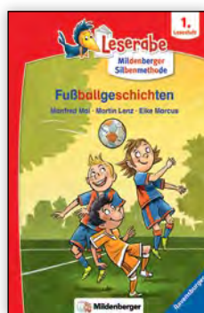
ab 1. Klasse

Ein Beispiel hierfür ist die Reihe Lesemaus aus dem Loewe Verlag. Zusätzlich werden als Hilfe für die Kinder Hauptwörter durch Bilder ersetzt.