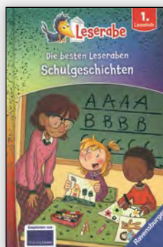
ab 1. Klasse