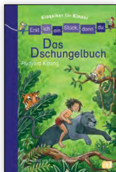
ab 1. Klasse

Mehrere Buchreihen unterstützen die Kinder beim Lesenlernen mit diesem Prinzip. Die in Kooperation mit dem Mildenerger Verlag bei Ravensburg verlegte Reihe bietet eine Menge unterschiedlicher Themen für viele Leseansprüche.