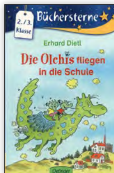
ab 2. Klasse

Bücher, die eigentlich für ältere Kinder geschrieben wurden, werden für Jüngere umgeschrieben und altersgerecht angepasst. Man nutzt so die Tatsache, dass auch Jüngere die Reihen kennen und die Kinder sind hochmotiviert, Bücher „für Große“ zu lesen.