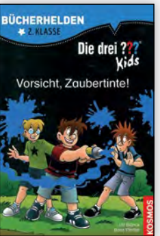
ab 2. Klasse

Für solche Fälle haben Verlage Geschichtenbände entworfen, in denen mehrere kleine Geschichten zusammengefasst sind, meistens zu einem gemeinsamen Thema. Diese ermöglichen den Kindern das Erfolgserlebnis, eine ganze Geschichte zu lesen.