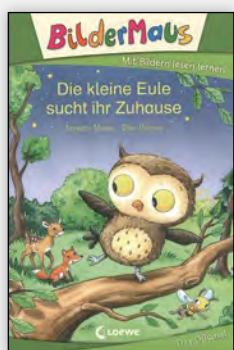
ab 1. Klasse

Erstlesebücher sollen vor allem eins: über Erfolgserlebnisse die Lesemotivation wecken. Dafür braucht es besonders bei Schwierigkeiten beim Lesenlernen sehr passgenaue Angebote, die hinsichtlich Schwierigkeit und Thema auf die Kinder abgestimmt werden. Die empfohlenen Lesereihen wenden sich vor allem an Kinder in der ersten bis zweiten Klasse und eher schwache Leser in der dritten und vierten Klasse.