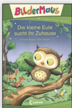
ab 1. Klasse

Erstlesebücher sollen vor allem eins: über Erfolgserlebnisse die Lesemotivation wecken. Dafür braucht es besonders bei Schwierigkeiten beim Lesenlernen sehr passgenaue Angebote, die hinsichtlich Schwierigkeit und Thema auf die Kinder abgestimmt werden. Die empfohlenen Lesereihen wenden sich vor allem an Kinder in der ersten bis zweiten Klasse und eher schwache Leser in der dritten und vierten Klasse.