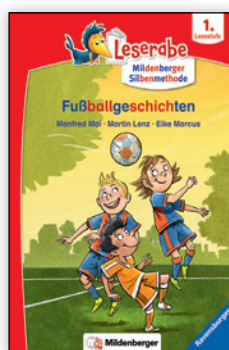
ab 1. Klasse

Ein Beispiel hierfür ist die Reihe Lesemaus aus dem Loewe Verlag. Zusätzlich werden als Hilfe für die Kinder Hauptwörter durch Bilder ersetzt.