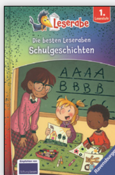
ab 1. Klasse