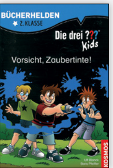
ab 2. Klasse

Für solche Fälle haben Verlage Geschichtenbände entworfen, in denen mehrere kleine Geschichten zusammengefasst sind, meistens zu einem gemeinsamen Thema. Diese ermöglichen den Kindern das Erfolgserlebnis, eine ganze Geschichte zu lesen.