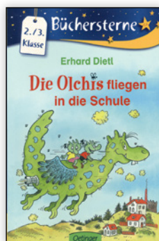
ab 2. Klasse

Bücher, die eigentlich für ältere Kinder geschrieben wurden, werden für Jüngere umgeschrieben und altersgerecht angepasst. Man nutzt so die Tatsache, dass auch Jüngere die Reihen kennen und die Kinder sind hochmotiviert, Bücher „für Große“ zu lesen.