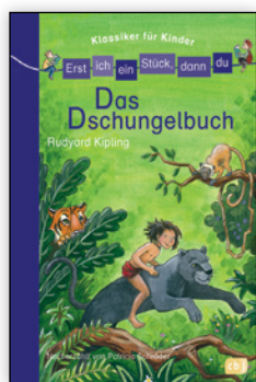
ab 1. Klasse

Mehrere Buchreihen unterstützen die Kinder beim Lesenlernen mit diesem Prinzip. Die in Kooperation mit dem Mildenerger Verlag bei Ravensburg verlegte Reihe bietet eine Menge unterschiedlicher Themen für viele Leseansprüche.